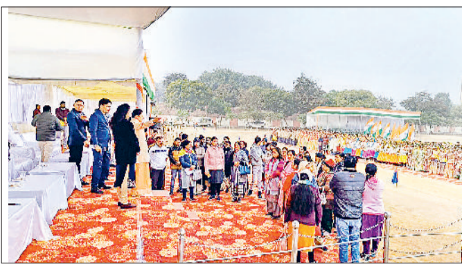
शिक्षकों को डांटते हुए एडीसी।