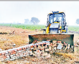
गन्नौर। अवैध कालोनी में हुए निर्माण को ढहाती जेसीबी।