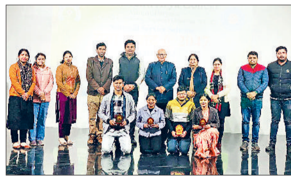
सोनीपत। विजेताओं को सम्मानित करते हुए अतिथिगण।