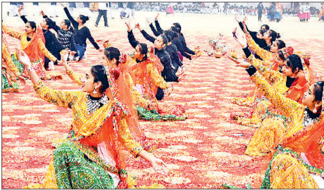
सोनीपत। फुल ड्रेस रिहर्सल के दौरान प्रस्तुति देते हुए विद्यार्थीगण।