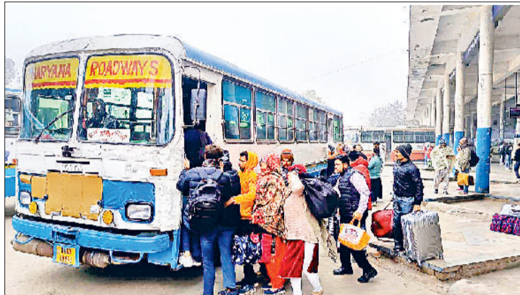
सोनीपत। दिल्ली रूट पर बस में बैठते यात्री।

बता दें कि हरियाणा रोडवेज कर्मचारी सांझा मोर्चा ने लंबित 16 मांगों को लेकर 24 जनवरी को एक दिवसीय हड़ताल की घोषणा की थी। जिनमें मुख्य रूप से 265 मार्गों पर परमिट देने की योजना को रद्द करने, परिचालक, चालक, लिपिकों सहित सभी प्रकार की वेतन विसंगतियों को दूर करने, 1992 से 2003 के मध्य लगे सभी कर्मचारियों की नियुक्ति तिथि से पक्का करने सहित अन्य मांगें शामिल रही। सरकार की तरफ से मांगों पर कोई सकारात्मक कदम नहीं उठाने से नाराज रोडवेज कर्मचारियों ने बुधवार को हड़ताल कर सरकार के खिलाफ रोष जताने का निर्णय लिया था। लेकिन सांझा मोर्चा की हड़ताल बेअसर रही।