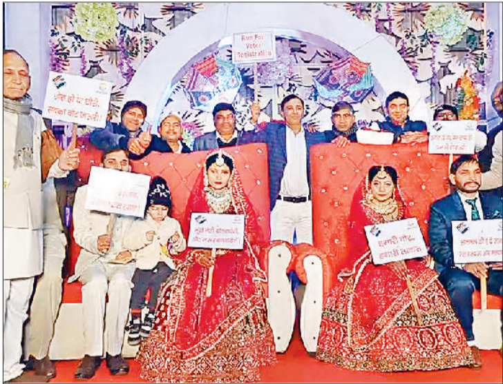
सोनीपत। शादी समारोह में मतदान के लिये प्रेरित करते नवविहिता जोड़ा साथ में परिजन।