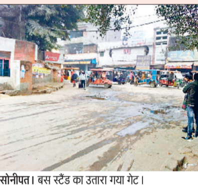
सोनीपत। बस स्टैंड का उतारा गया गेट।

सोनीपत रोडवेज बेड़े में 215 बसें शामिल हैं। इसमें सोनीपत बस अड्डे पर 141 और गोहाना में 74 बसें हैं। कर्मचारियों की हड़ताल के बीच दोपहर बाद तक सोनीपत बस अड्डे से 112 बसें, जबकि गोहाना बस अड्डे से दोपहर बाद तक 10 बसें सड़कों पर उतारी गई थी। सोनीपत बस अड्डे पर 24 कर्मचारी ही हड़ताल में शामिल हुए इनमें 16 परिचालक व आठ चालक शामिल हैं। वहीं गोहाना में 110 कर्मचारी हड़ताल में शामिल रहे। इनमें 63 चालक व 67 परिचालक शामिल रहे।