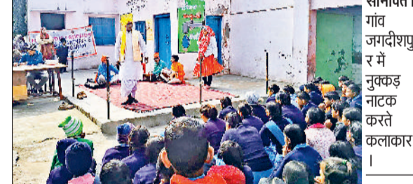
सोनीपत। गांव जगदीशपुर में नुककंड नाटक करते कलाकार।