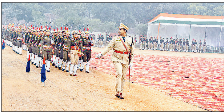
फुल ड्रेस रिहर्सल में परेड करते हुए हरियाणा पुलिस के जवान।