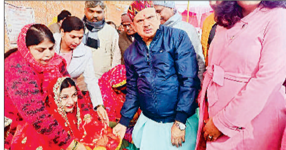
खरखौदा। गर्भवती महिलाओं को फल वितरित करते सांसद रमेश कौशिक।

शहर के पात्र लाभार्थियों को केन्द्र व हरियाणा सरकार की योजनाओं का उनके घर द्वार पर लाभ देने के लिए विकसित भारत संकल्प यात्रा बुधवार को खरखौदा के जागृति स्थल तथा वार्ड नंबर -9 स्थित कम्प्युनिटी सेंटर पहुंची। जागृति स्थल पर आयोजित जनसंवाद कार्यक्रम का शुभारंभ बतौर मुख्यातिथि सांसद रमेश कौशिक ने किया। इस दौरान उन्होंने लोगों की समस्याएं सुनी और मौके पर ही उनका समाधान करते हुए अधिकारियों को उचित दिशा-निर्देश दिए। वार्ड नंबर-9 स्थित कम्प्युनिटी