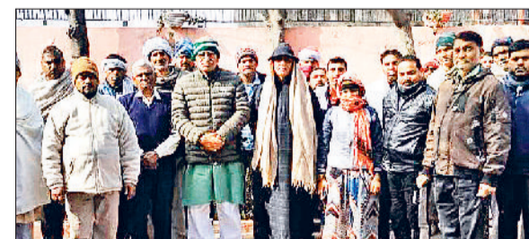
सोनीपत। बैठक के दौरान मौजूद समिति के पदाधिकारी एवं सदस्यगण।